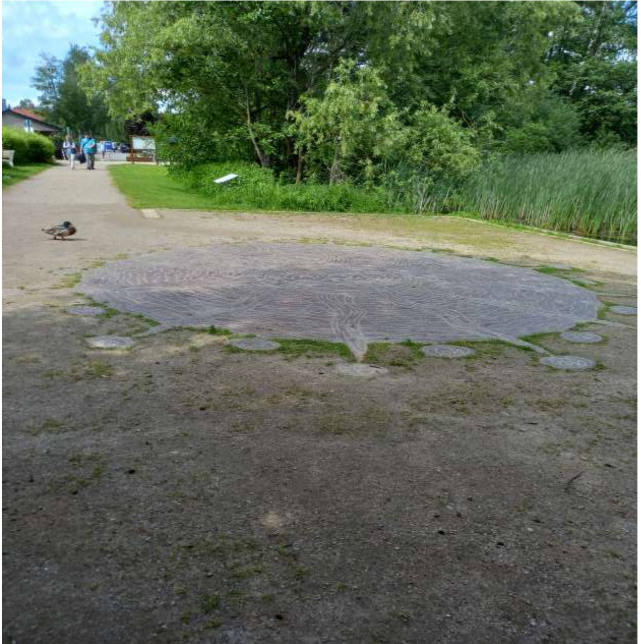
Die Bodensonnenuhr vor dem Anleger Janus der Kellerseerundfahrt ohne POLSTAB

Tatsächlich aber steht diese Ziffernfolge als Nummerierung einer Sonnenuhr in einen Katalog über Sonnenuhren in Deutschland und der Schweiz. Die Stellenanzahl weist augenscheinlich doch auf eine Vielzahl von derartigen Uhren in den Ländern hin.